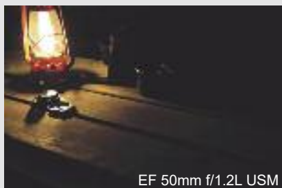
EF 50mm f/1.2L USM