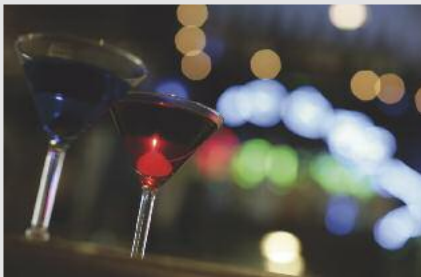
A abertura f/1.2 produz desfoques muito atraentes, suaves e com pontos de luz circulares