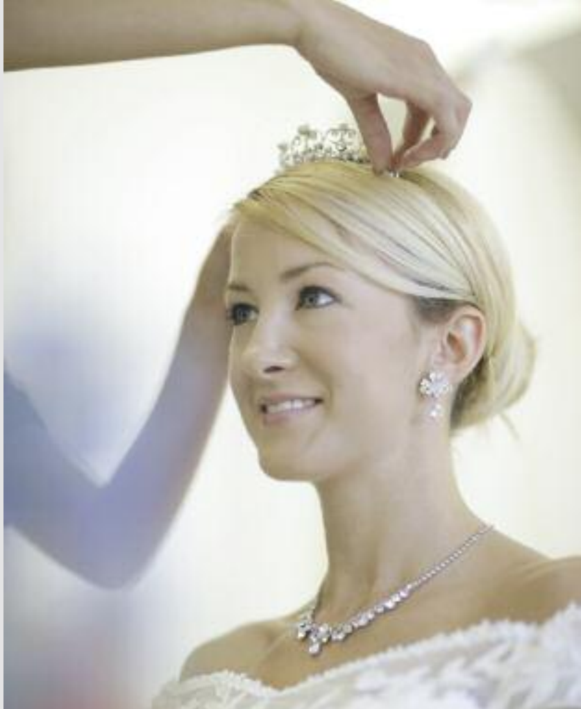
A EF 50mm f/1.2L USM é especialmente indicada para retratos, moda e casamentos

Como alternativa econômica, a Canon disponibiliza outras duas lentes padrão: a EF 50mm USM f/1.4 USM e EF 50mm f/1.8 STM, em corpos de policarbonato bem mais leves, sem comprometer a qualidade de imagem. Mais informações sobre essas e outras lentes em www.canon.com.br/lentes , www.canon.com.br/lentes-l , www.college.canon.com.br