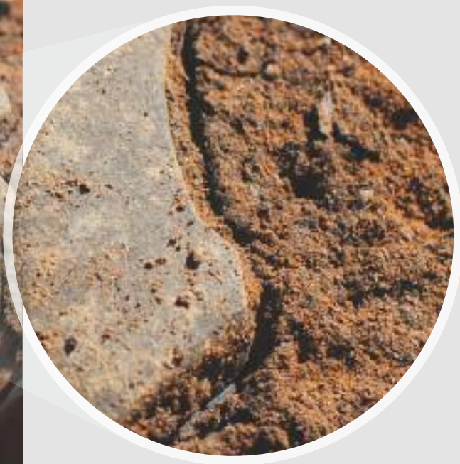
A grande nitidez e a qualidade de imagem são pontos fortes desta lente profissional da Série L da Canon, como mostra o detalhe ampliado da foto acima, registrada com câmera Canon EOS 5D Mark II, f/5.6, 1/320s e ISO 100