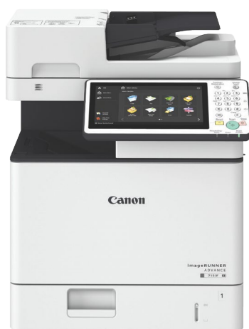
Modelo padrão (615iF/525iF)*